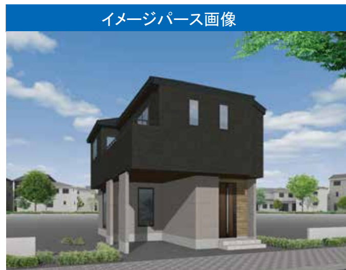
イメージパース画像