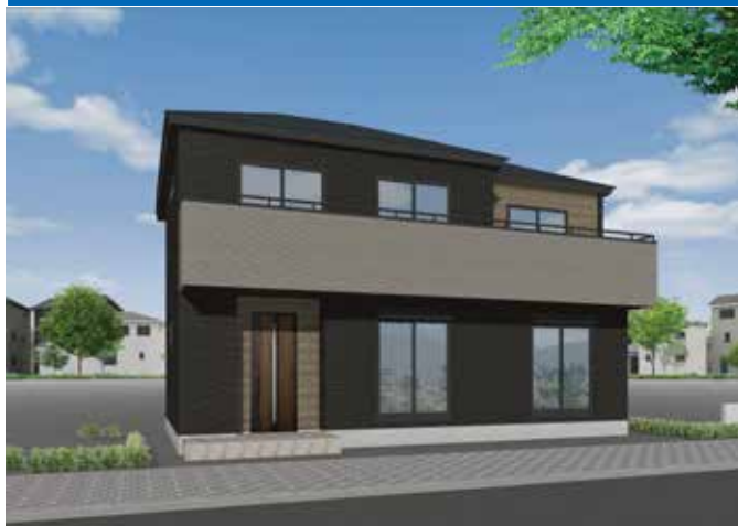
イメージパース画像