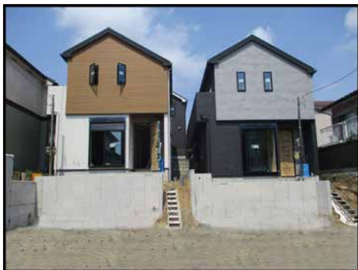
イメージパース画像

JR 八高線「小宮」駅 徒歩 26 分 「日野駅」バス 10 分 「宇津木」停歩 5 分