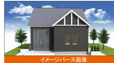
イメージパース画像