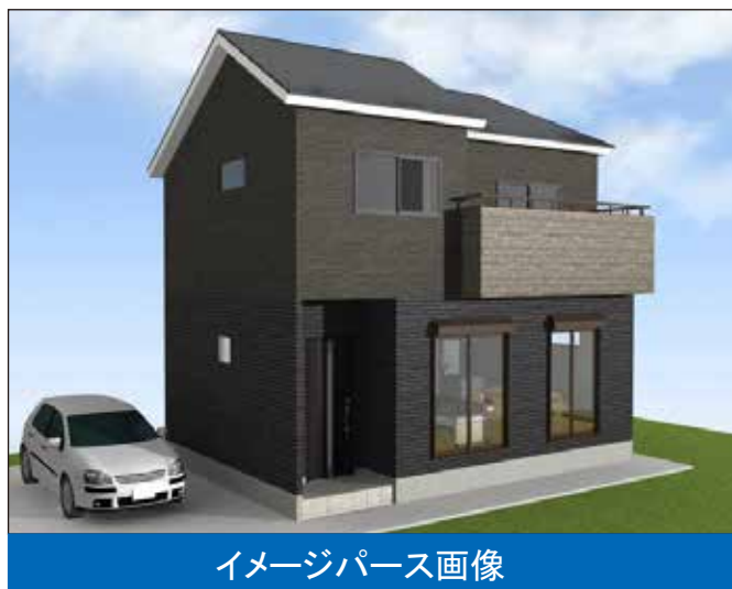
イメージパース画像