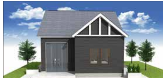
イメージパース画像