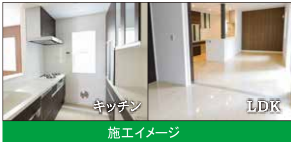
キッチン LDK 施工イメージ